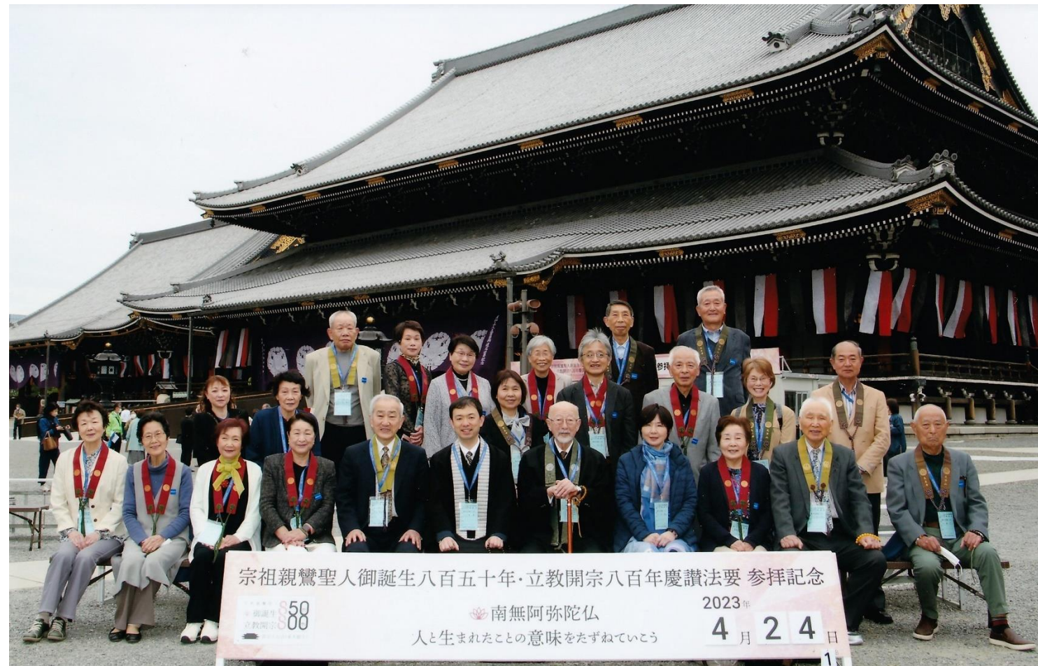
宗祖親鸞聖人御誕生八百五十年・立教開宗八百年慶讃法要 参拝記念 2023年 4月24日 南無阿弥陀仏 人と生まれたことの意味をたずねていこう

参拝終了後、境内にて寺泊地区寺院と御門徒さんとで記念写真(2023年4月24日)